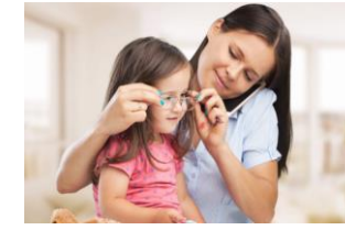
Vivienda y Refugio