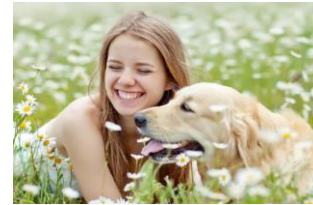
Salud Conductual y Salud Mental