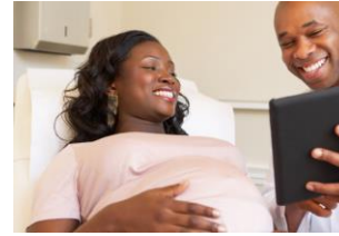
Bebés y niños