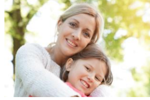
Violencia Doméstica. Recursos y Ayuda