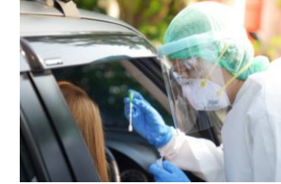
Información sobre la COVID-19 y Otros Recursos Comunitarios