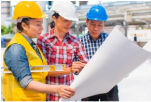
Empleo y Recursos para el Desempleo