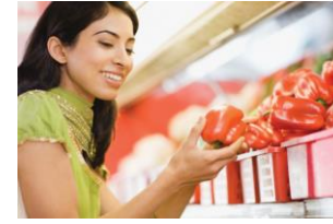
Distribución de Alimentos y Comestibles