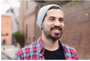
Consumo de Sustancias, Adicción y Recuperación