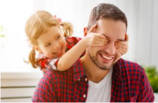
Asuntos Legales e Inmigración